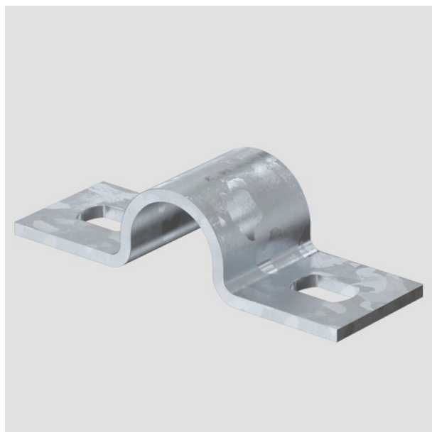
Collare di fissaggio a due linguette 16 mm